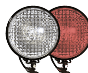
фары на СИМ